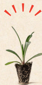
ガザニアンクイーンJ 根鉢径 30mm