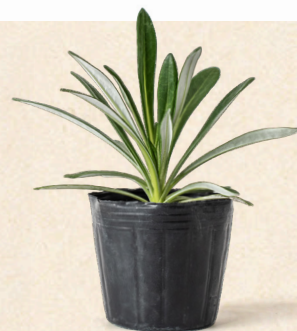
従来のガザニアン 根鉢径 90mm