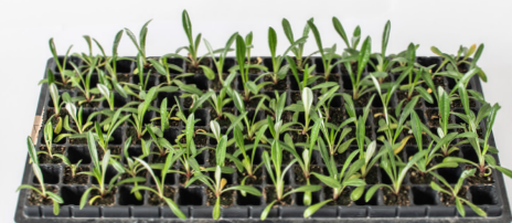
乾燥に強く、成長の早い特性からセル状苗での植栽が可能に

※ シートは透水通気性に優れ目詰まりの少ないタイプを選定下さい。又、シート開孔作業は材質など考慮した工法の検討をお勧めします。 ※ 根鉢形状：約φ3.0cm／1.5cm×H4.5cm（内外）