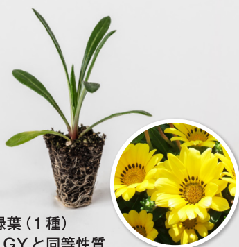
苗仕様： 黄色花／緑葉（1種） クイーンLGYと同等性質

従来のシート加工やカット極狭部への作業がコンパクトになり施工コストを抑えることができます。