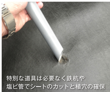
特別な道具は必要なく鉄杭や塩ビ管でシートのカットと植穴の確保